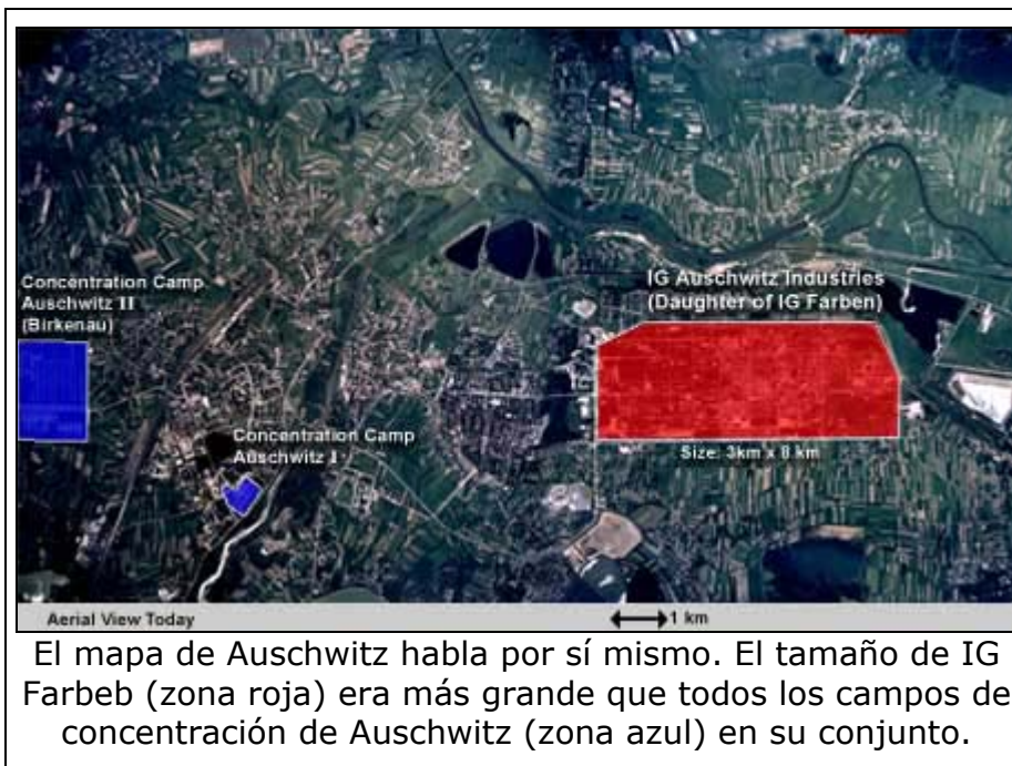
El mapa de Auschwitz habla por sí mismo. El tamaño de IG Farbeb (zona roja) era más grande que todos los campos de concentración de Auschwitz (zona azul) en su conjunto.

Al mismo tiempo, Dr. Joseph Mengele experimentó en Auschwitz con medicamentos que fueron designados como "B-1012", B-1034 y 3382" o "Rutenol". Los preparativos de prueba no sólo se aplicaron a los presos que estaban enfermos, sino también a los sanos. Estas personas fueron infectadas por primera vez a propósito, a través de pastillas, sustancias en polvo, las inyecciones o enemas. Muchos de los medicamentos causaron a las víctimas al vómito o diarrea sanguinolenta. En la mayoría de los casos de los presos murieron como resultado de los experimentos.